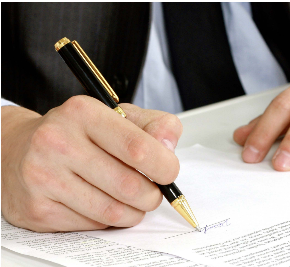
Verträge schaffen Klarheit beim Aussenhandel.